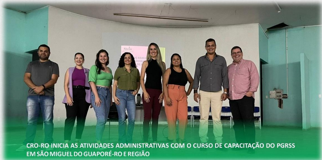
CRO-RO INICIA AS ATIVIDADES ADMINISTRATIVAS COM O CURSO DE CAPACITAÇÃO DO PGRSS EM SÃO MIGUEL DO GUAPORÉ-RO E REGIÃO